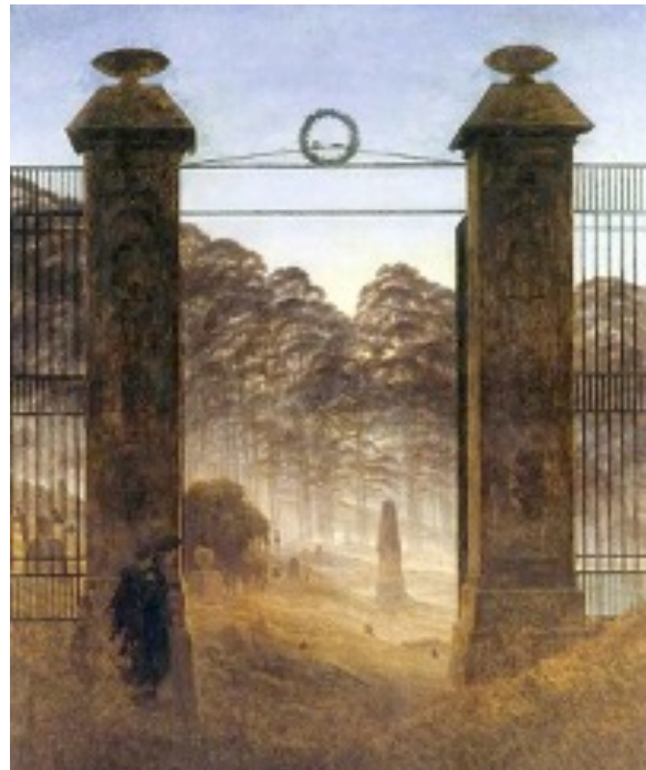
Das im Jahr 1825 von Caspar David Friedrich begonnene, aber nicht vollendete Bild „Friedhofseingang“ zeigt das Tor des Dresdner Trinitatisfriedhofs, auf dem der Maler seit 1840 selbst ruht.

Vom ersten Grabmal des mittellos verstorbenen Malers, dessen Kunst noch lange Jahrzehnte nach seinem Tod als „zu düster“ keine rechte Beachtung fand, ist wenig bekannt. Die jetzige eher schlichte Grabplatte stammt aus dem Jahr 1930 und muss dringend restauriert werden. Zum 250. Geburtstag 2024 des inzwischen weltberühmten Malers haben eine Stiftung sowie der Freundeskreis Caspar David Friedrich dazu aufgerufen, das vorhandene Grabmal instandzusetzen und zudem mit einem Denkmal zu versehen. Dazu werden bei veranschlagten 42.000 € etwa 10.000 € Spenden benötigt. Der Literaturlandschaften e.V. hat sich nicht nur angesichts der bedeutenden Rolle, die der Maler längst auch in der Literaturgeschichte spielt, mit Vergnügen zu einem eigenen Beitrag an den Restaurierungskosten entschlossen.